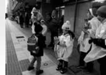
山形市七日町にて