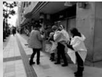
山形市七日町にて