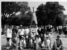
ヒロシマ平和行動