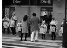
山形市七日町にて