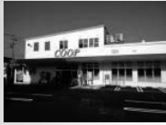
山形市コブひがしはら スーパーマーケット形態