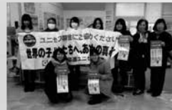
コブこびあ酒田にて