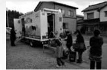
移動店舗(せいきょう便)