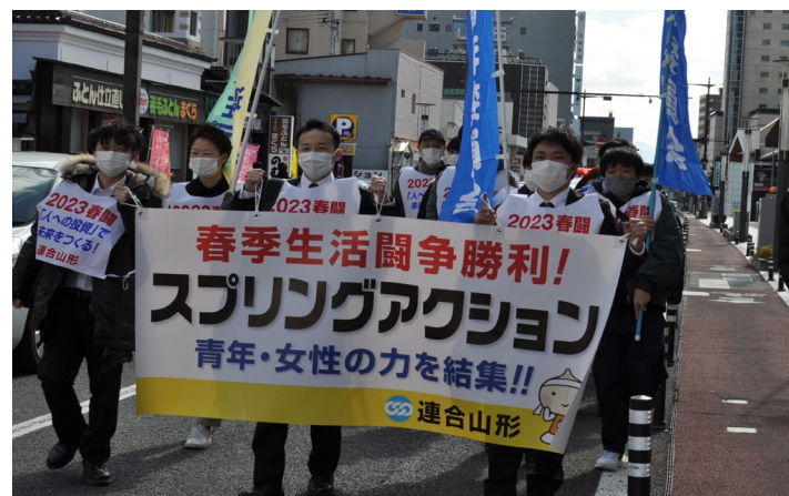
2023/3/4 青年女性スプリングアクション