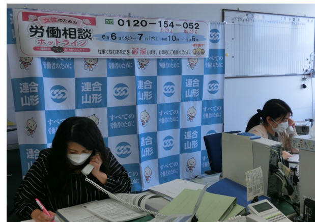
2023/6/6-7女性のための労働相談ホットライン