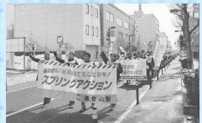
2014春闘スプリングアクション

青年委員会は、連合山形の各産別から青年労働者の代表者が集まり、青年の目線で労働組合運動を行っています。「学習と交流」をメインにして、若い世代の集まる場・話せる機会を設けています。今年度は、下記のスケジュールで青年委員会が主催します。是非、青年労働者の皆さんの参加をお待ちしています。