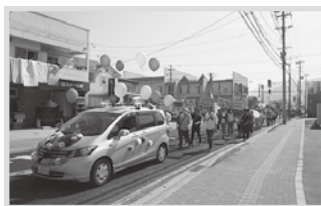
天童地区メーデー