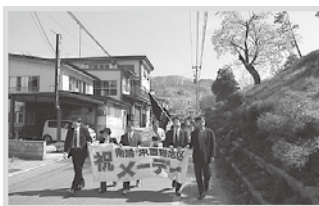
南陽・東置賜地区メーデー