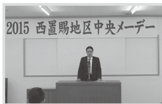
西置賜地区中央メーデー