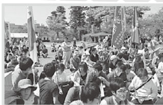
田川地区中央メーデー