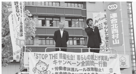
北西村山地協街宣行動