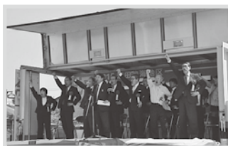
酒田飽海地区メーデー