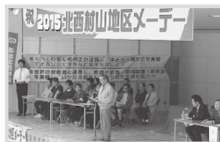
北西村山地区メーデー