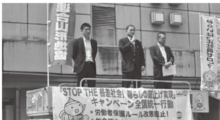
山形地協街宣行動