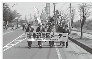
米沢地区メーデー