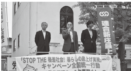
新庄最上地協街宣行動