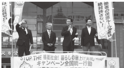
置賜地協街宣行動