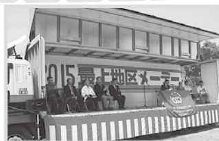
最上地区メーデー