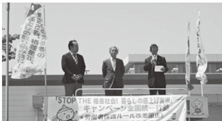
鶴岡田川地協街宣行動