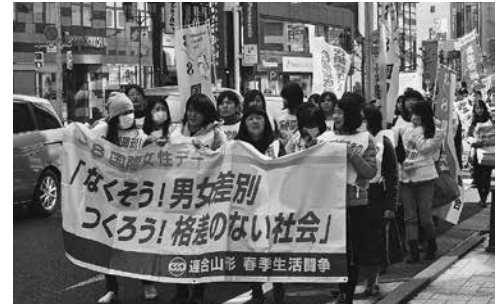
女性委員会によるデモ行進

第2部として、山形市七日町において女性委員会役員と組合員による「3.8国際女性デー周知行動」を行い、「3.8国際女性デー」チラシを入れたバラの花を配布しながら、役員によるリレートークを行いました。市民からは「国際女性デーとバラの花の関連性は？」という質問や「きれいなバラをありがとう」などと声をかけられていました。