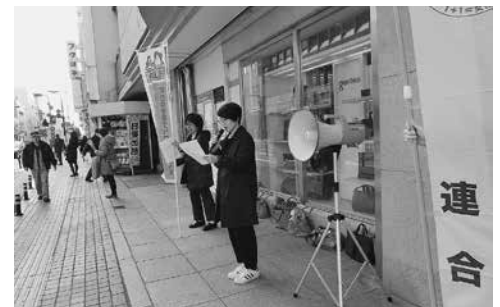
バラを配りながら「国際女性デー周知行動」