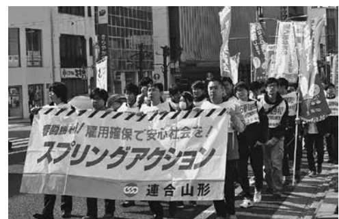
青年委員会によるデモ行進