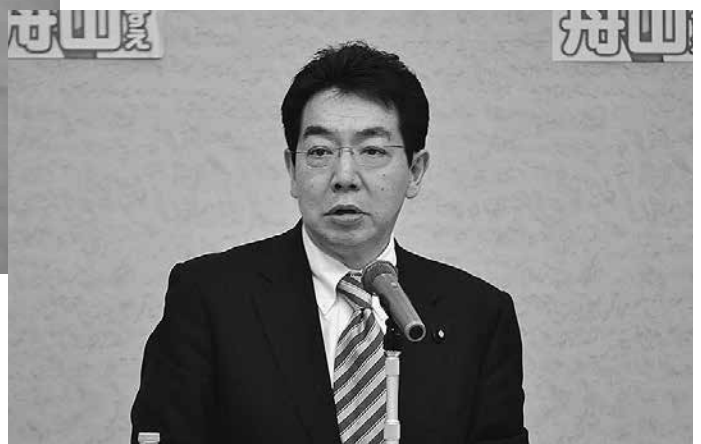
講演される近藤洋介衆議院議員