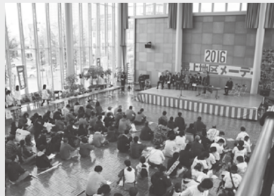
最上地区メーデー