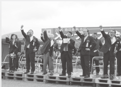
酒田飽海地区メーデー