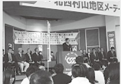
北西村山地区メーデー