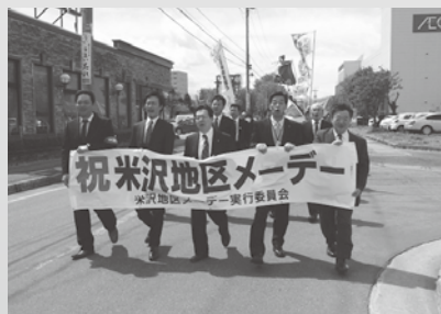
米沢地区メーデー