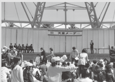
天童地区メーデー