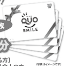
(写真はイメージです)