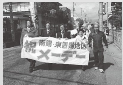
東置賜地区メーデー