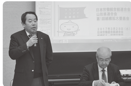
宇田川連合組織拡大・組織対策局長

連合は、1000万連合をめざして組織拡大に取り組んでいます。連合山形は、「第6次組織拡大3か年計画」の数値目標達成に向け、連合一連合山形（地域協議会）-構成組織の三位一体で、組織拡大に取り組んでいきます。多くの仲間を増やし、職場の環境改善、労働条件の向上、安心して働ける社会の実現に向かって、みなさん頑張りましょう！