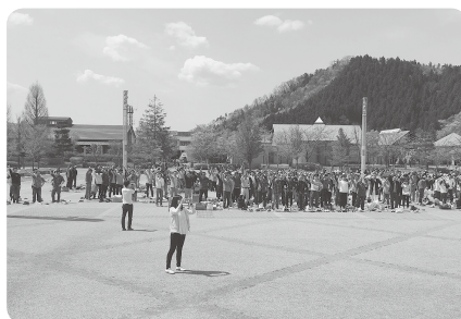
天童地区メーデー