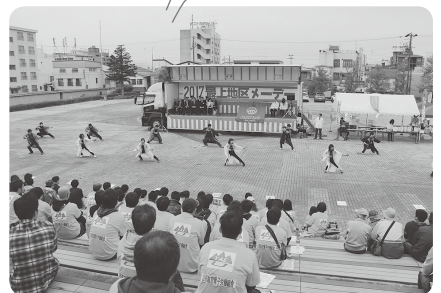
最上地区メーデー