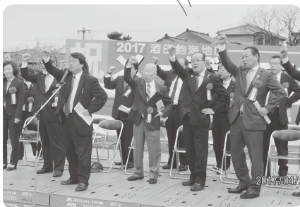
酒田飽海地区メーデー