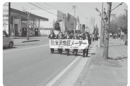
米沢地区メーデー