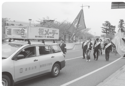
田川地区メーデー