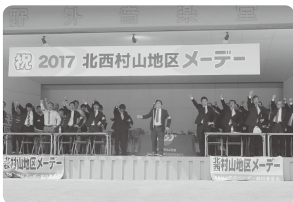
北西村山地区メーデー