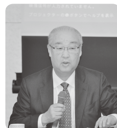
二宮連合中央 アドバイザー