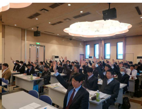
【出席代議員による承認】