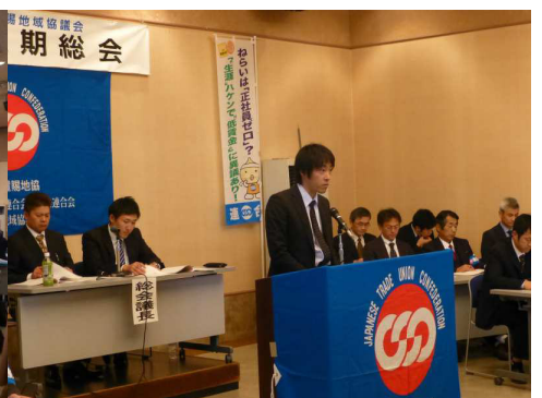
【深瀬役員選考委員会委員長報告】