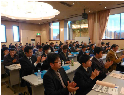
【功労者への満場の拍手】