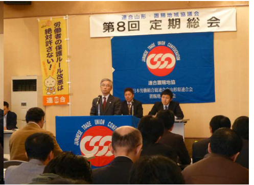
【連合山形大泉会長挨拶】