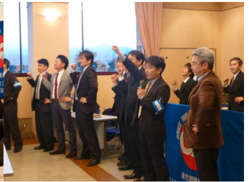
【団結ガンバロー三唱】