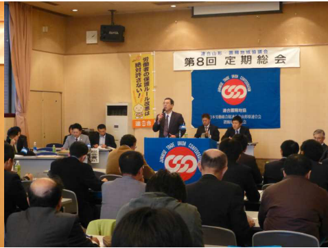
【置賜地協菊地(前)議長挨拶】