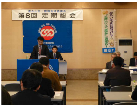
【近藤洋介議員小鯖秘書代読挨拶】