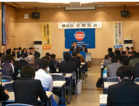
【東北労金佐々木支店長挨拶】