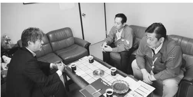
ルネサスグループ労組