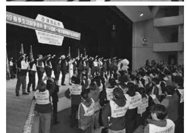
2019春季生活闘争総決起集会