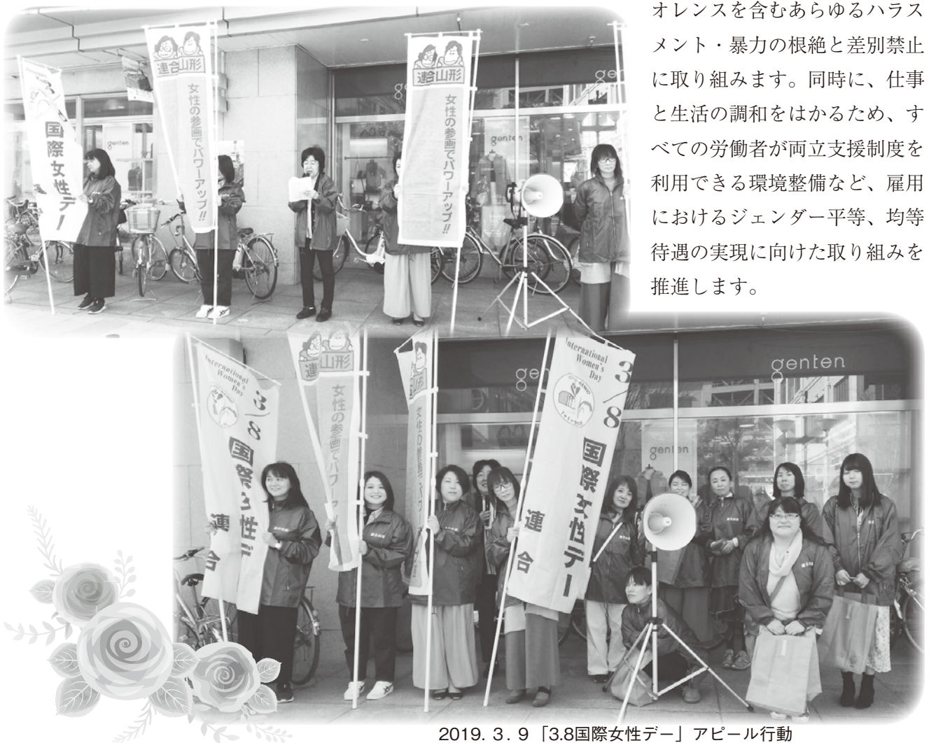
2019. 3. 9 「3.8国際女性デー」アピール行動

オレンスを含むあらゆるハラスメント・暴力の根絶と差別禁止に取り組みます。同時に、仕事と生活の調和をはかるため、すべての労働者が両立支援制度を利用できる環境整備など、雇用におけるジェンダー平等、均等待遇の実現に向けた取り組みを推進します。