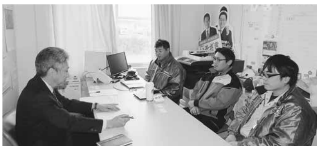
カルソニックカンセイ山形労組

第2弾として4月から6月の期間、各構成組織・各地域協議会と連携し、まだ春季生活闘争を続けている組合に対し激励訪問活動を継続実施します。