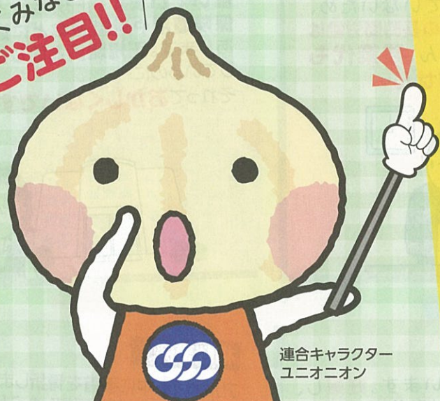
連合キャラクター ユニオニオン