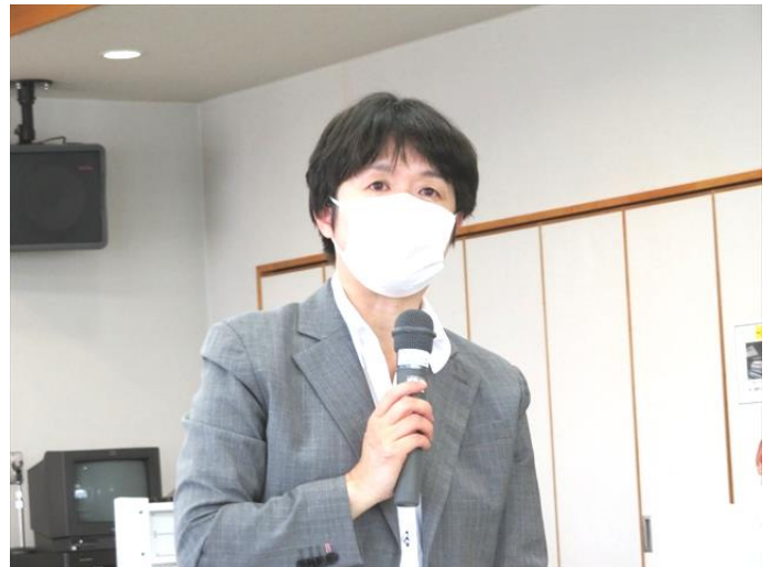
【議員団代表：舟山参議院議員より決意表明】