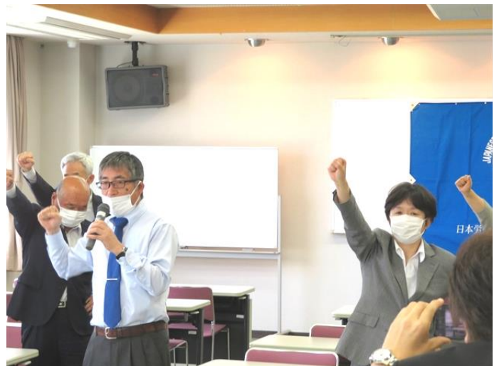
【参院選・統一地方選必勝ガンバローコール】