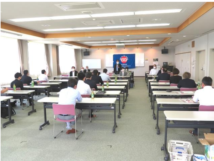
【議員懇談会全員協議会開催風景】