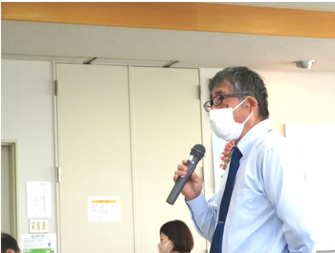
【主催者代表：舩山議長より挨拶】

我々働くものの政策実現の為、そして働きやすい・暮らしやすい国づくりに向けた運動に対し、皆さまからの引き続きのご協力を宜しくお願い申し上げます。