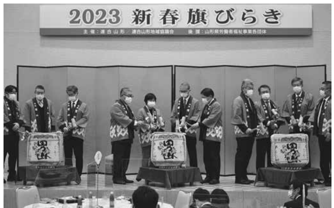
連合山形役員と来賓代表者で鏡びらき