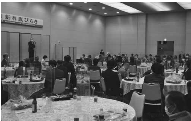
感染防止対策を講じて3年ぶりの対面開催