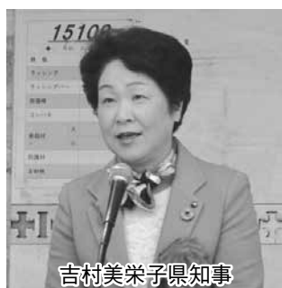
吉村美栄子県知事