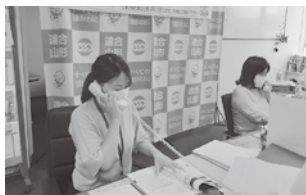
相談を受ける女性委員会役員

連合では、「働く女性」を対象とした、女性のための全国一斉労働相談ホットラインを毎年行っています。今年は6月6日（火）、7日（水）の両日行いました。相談件数は2日間で16件と多く、男性からの相談も4件ありました。内容は、パワハラや差別に関する相談が6件、労働契約相談が4件寄せられ、相談に対して女性相談員が相談者に寄り添い丁寧にアドバイスを行いました。