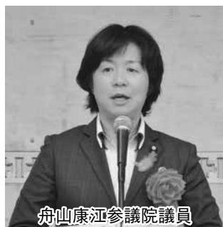
舟山康江参議院議員