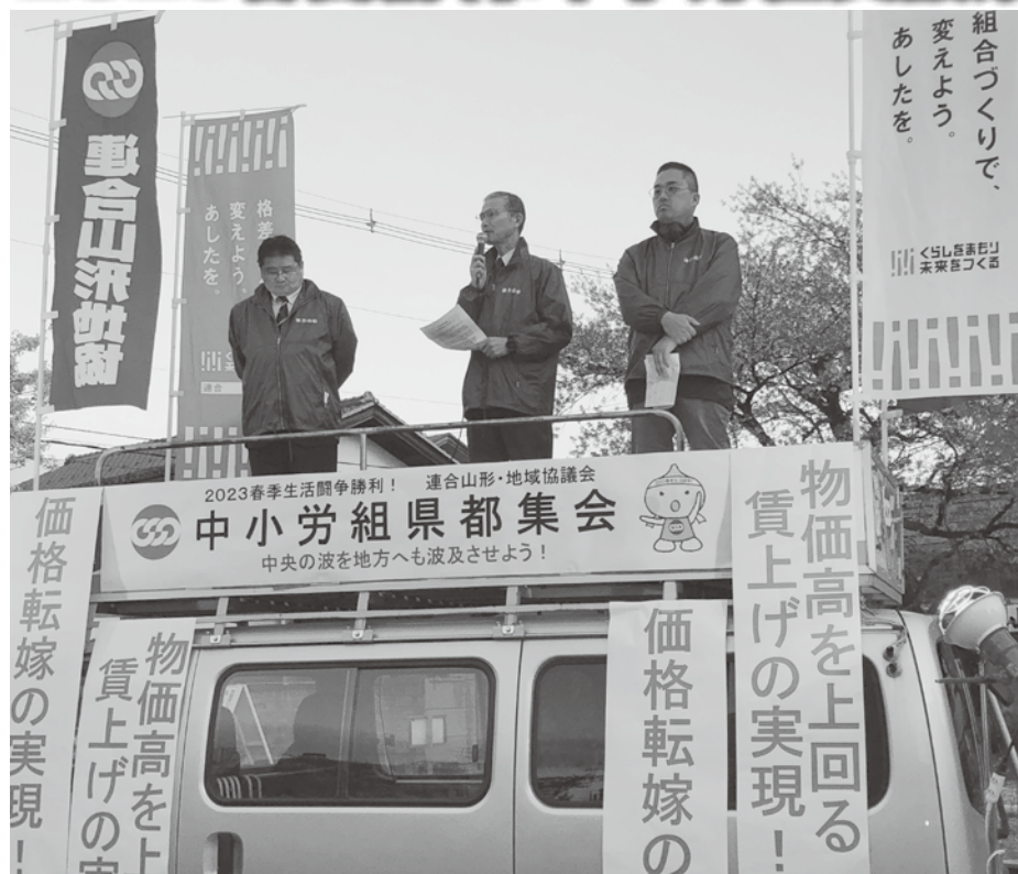
集会にあたりあいさつする船山会長（中央）