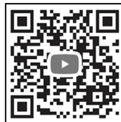
WorkルールラップQRコード