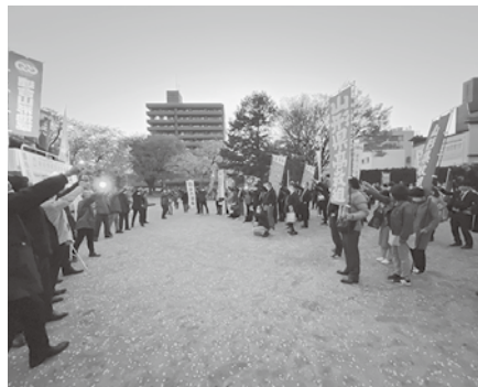
参加者全員で団結ガンバロー!