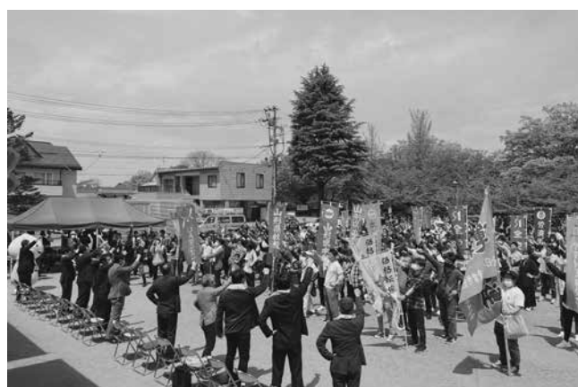
参加者全員でガンパロー三唱！！