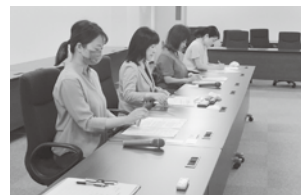
労働局に要請する女性委員会役員