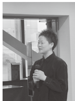
山形地女性委員会石岡副委員長